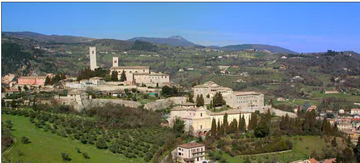
Fig. 2 Vista del castello al monte

L'orario d'ingresso è stato volutamente pensato affinché tutti i ragazzi provenienti da paesi vicini potessero raggiungere la scuola comodamente. L'istituto è facilmente raggiungibile sia dalla Stazione Ferroviaria che dal terminal dei bus. In un raggio di qualche centinaia di metri troviamo la Cattedrale e il Municipio. Sempre in questa area della città, ricca di storia e di arte, denominata "Castello", si trovano il Duomo Vecchio, costruito nel 944, riedificato nel 1061 e ampliato alla fine del sec. XII, con la facciata gotica dei primi del sec. XIV, il Chiostro del sec. XV e la Torre degli Smeducci della Scala di forma quadrata, alta circa 40 metri, risalente al sec. XIII che serviva per difesa, per prigione e per segnalazioni alle altre torri dei numerosi castelli del territorio comunale: Aliforni, Castel San Pietro, Isola, Colleluce, Carpignano, Serralta, Pitino, di cui restano imponenti ruderi.